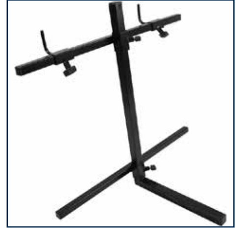
Rollator holder model C 599,00 kr