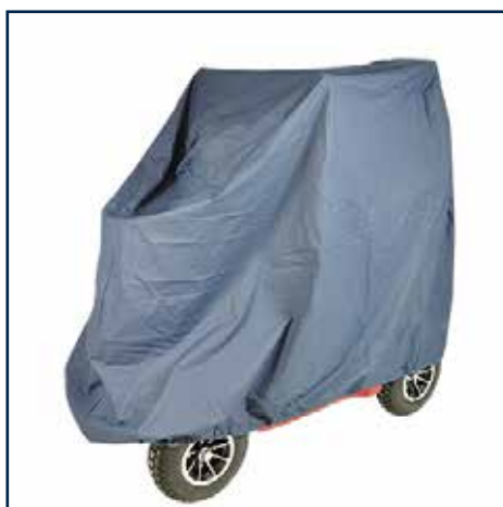
Standard garage 695,00 kr