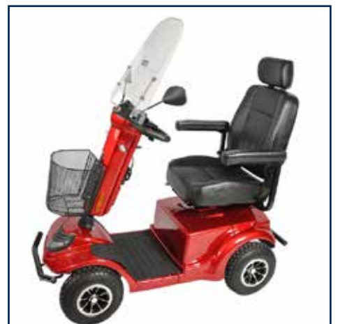
Vindskærm til El Scooter 695,00 kr