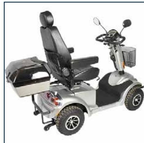
Bagageboks sølv med lås 975,00 kr