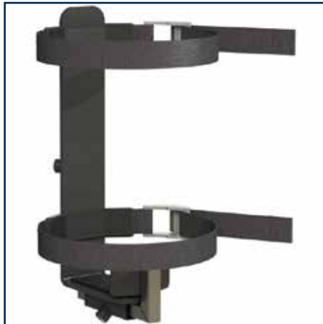
Iltflaske holder komplet 495,00 kr