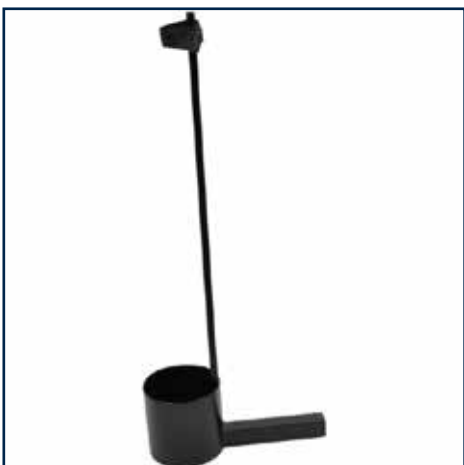
Dobbelt Stokkeholder 295,00 kr