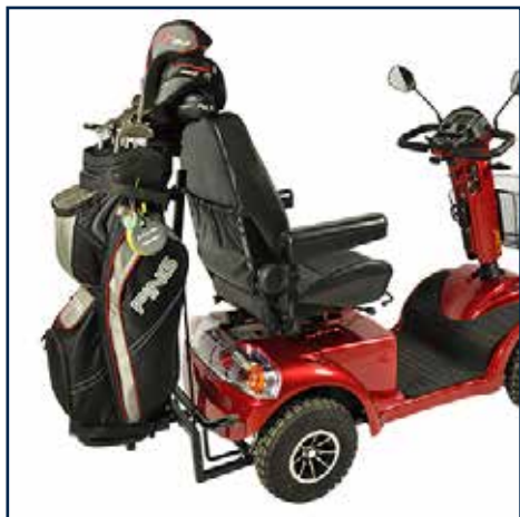
Golfbag holder/stativ 1 599,00 kr