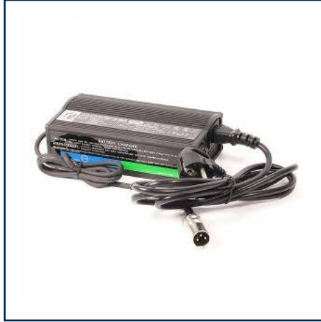
Oplader 845,00 kr