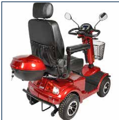
Bagageboks rød med lås 675,00 kr