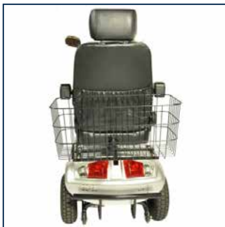
XL Bagkurv 449,00 kr