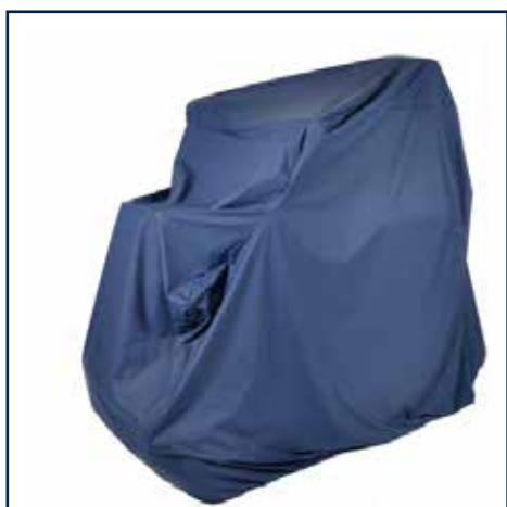
XXL Garage Sort 1.195,00 kr