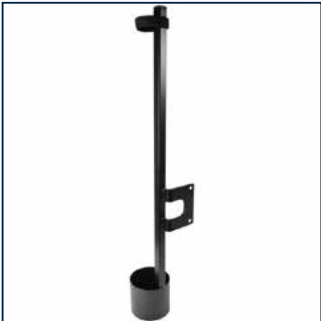
Dobbelt Stokkeholder model B 499,00 kr