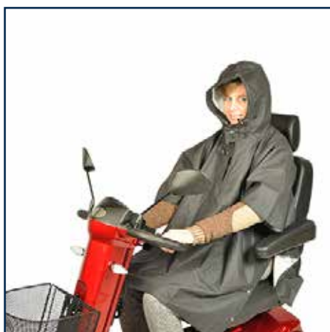
Regnslag 395,00 kr