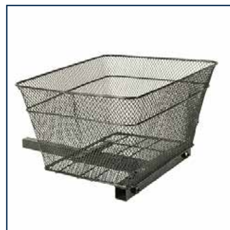
Bagkurv model 4 398,00 kr