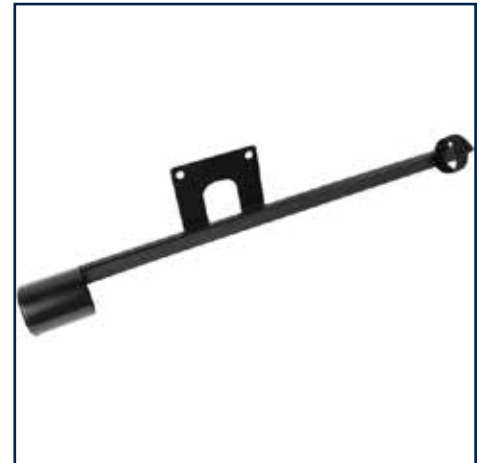
Stokkeholder til sædemontering i højre side 399,00 kr