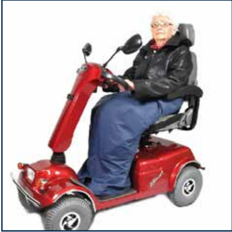
Køreslag 475,00 kr