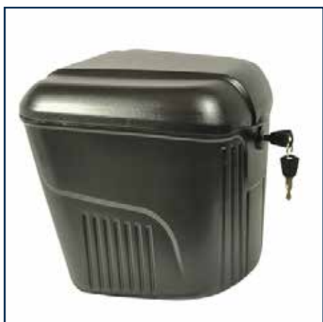
Aflåselig bagageboks 389,35 kr