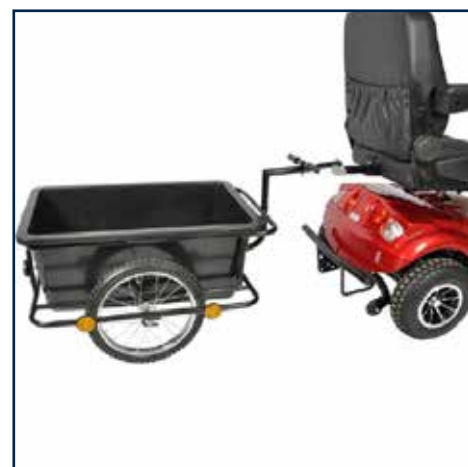
Anhænger 1 549,00 kr